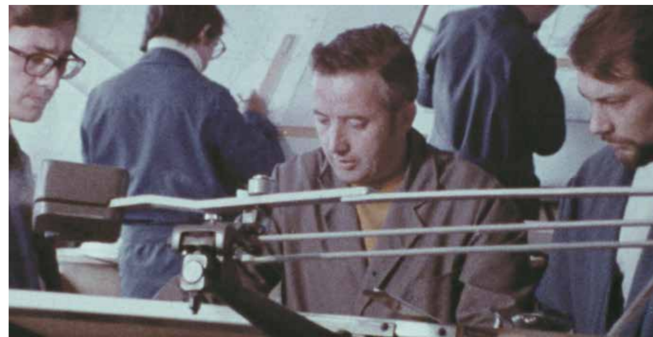
« SNR Roulements » de Jean Salvy, Fonds NTN-SNR, Collection Archives départementales de Haute-Savoie

Les réalisations audiovisuelles résultant du projet ENTRE2PRISES viennent en soutien des industries dans leur stratégie de recrutement. Les réseaux professionnels et groupements d'entreprises peuvent aussi les utiliser pour leur communication. Lieux d'accueil du public et temps de présentations peuvent être enrichis de cette matière nouvelle. Les partenaires prennent connaissance des ressources de la CPSA pour alimenter en images leurs stratégies de contenu.