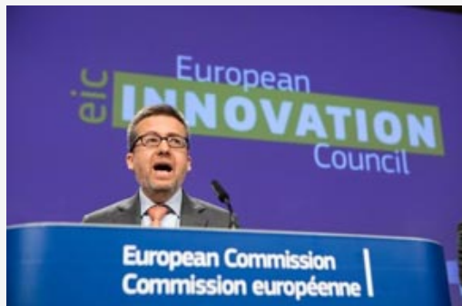
Carlos Moedas, Commissaire à la Recherche, la Science et l'Innovation

En 2021, Horizon 2020, le programme de financement de la recherche et de l'innovation par la Commission Européenne fera place à Horizon Europe. C'est dans ce cadre qu'a été créé le Conseil Européen de l'Innovation, lancé en phase pilote en 2017 et qui sera pérennisé en 2021. Le Ministère de l'Enseignement Supérieur, de la Recherche et de l'Innovation définit le European Innovation Council - EIC comme suit : « Il vise à constituer un outil stratégique qui permettra de soutenir l'innovation de rupture créatrice à l'échelle européenne, en lien avec les niveaux nationaux et locaux. Sur la base des instruments qui existent déjà dans le reste du programme, il sera mis en œuvre à travers un nouveau panel d'instruments plus flexibles et spécifiquement dédiés à ce type d'activités : Pathfinder (subvention des projets qui ne peuvent bénéficier de financements bancaires) et Accelerator (financements EIC mixtes) ». Pour en savoir plus